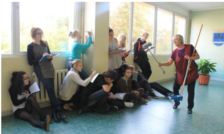
«Любимый уголок в школе», 9а класс