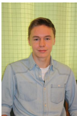
Министр внутренних дел Муравьёв Игорь