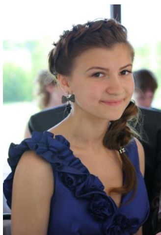
Министр культуры Анцвериня Диана