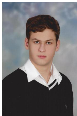
Министр образования Бобров Илья