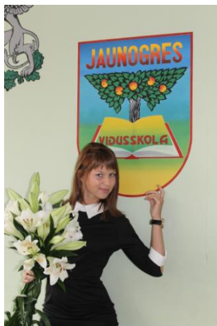
Президент Парламента Иванченко Екатерина