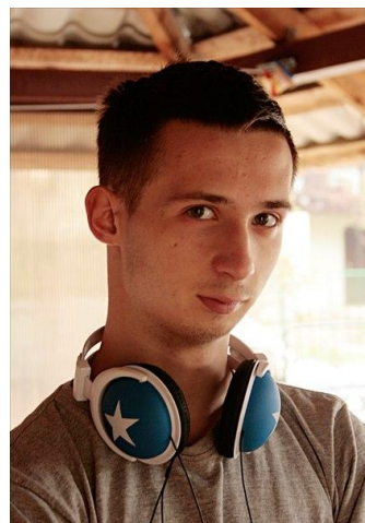
Министр спорта Цингелис Никита