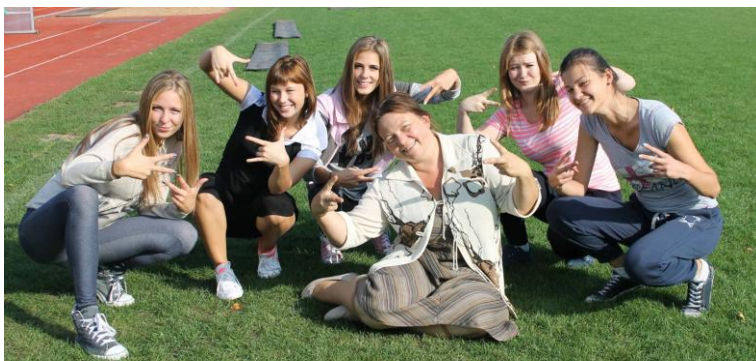
«Фотография с учителем», 12 класс