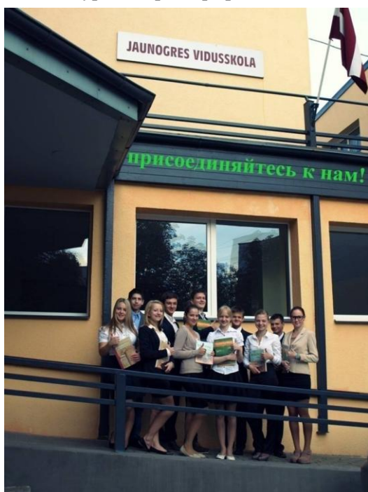
«Реклама школы», 10а класс.

Все конкурсные фотографии вы можете посмотреть в разделе "Галерея" на нашем сайте www.jvsk.lv